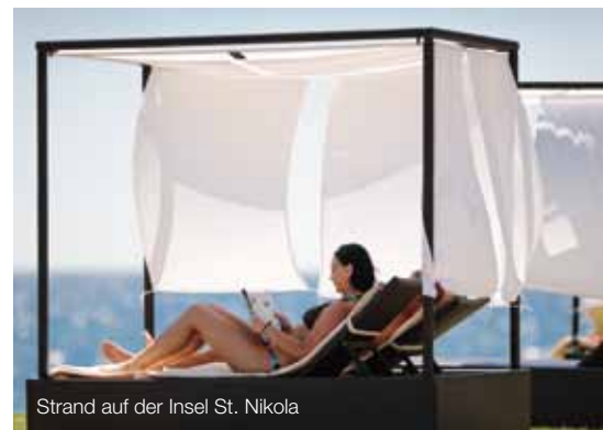
Strand auf der Insel St. Nikola