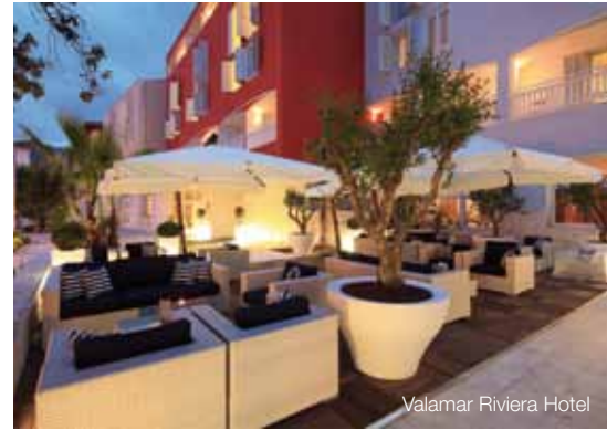
Valamar Riviera Hotel