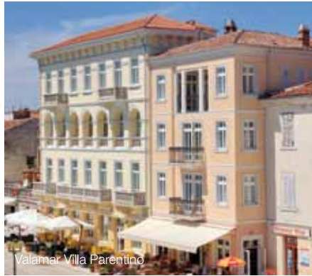
Valamar Villa Parentino

T +385 52 408 040 F +385 52 423 073 E reservations@valamar.com Valamar Reservierungs Center +385 52 465 000 www.valamar.com