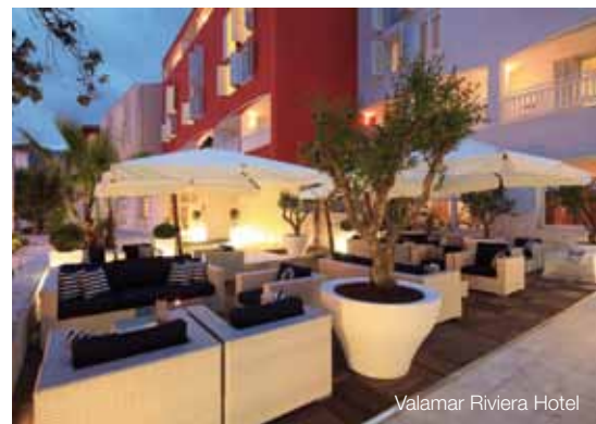
Valamar Riviera Hotel