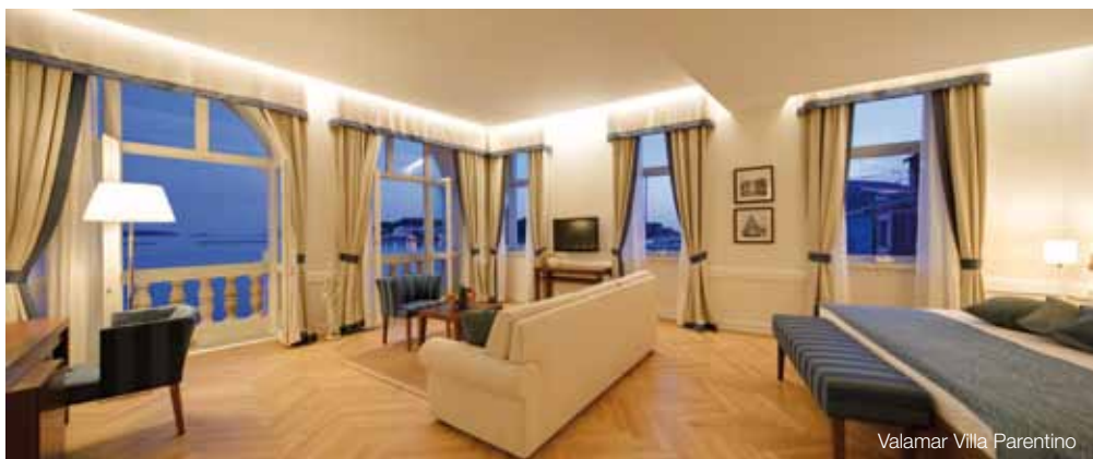
Valamar Villa Parentino

Valamar Riviera Hotel nalazi se na samoj porečkoj rivi nedaleko od poznate povijesne gradske jezgre. Zbog mnogih atrakcija i visoke kvalitete usluga predstavlja savršen izbor za bogat kulturni odmor i uspješne poslovne trenutke.