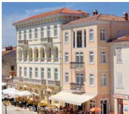
Valamar Villa Parentino

T +385 52 408 000 F +385 52 423 073 E reservations@valamar.com Valamar rezervacijski centar +385 52 465 000 www.valamar.com