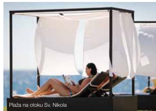
Plaža na otoku Sv. Nikola